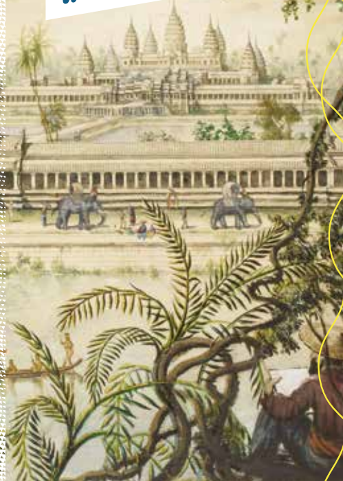
Aquarelle de Louis Delaporte (détail)