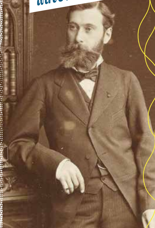
Louis Delaporte