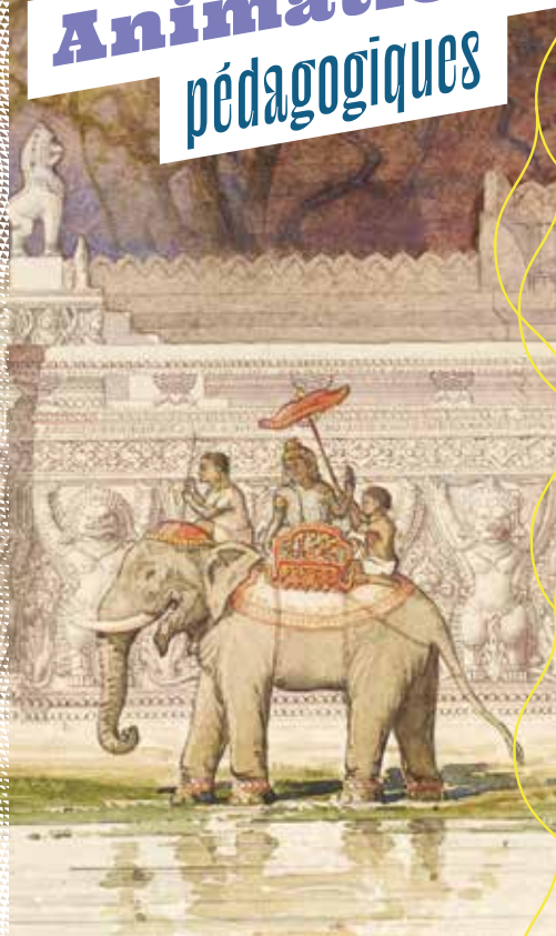
Aquarelle de Louis Delaporte (détail) ©Musée Guimet, Paris / Thierry Ollivier